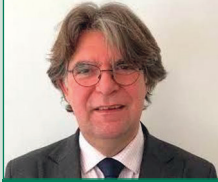
Directeur: Wim van der Sande